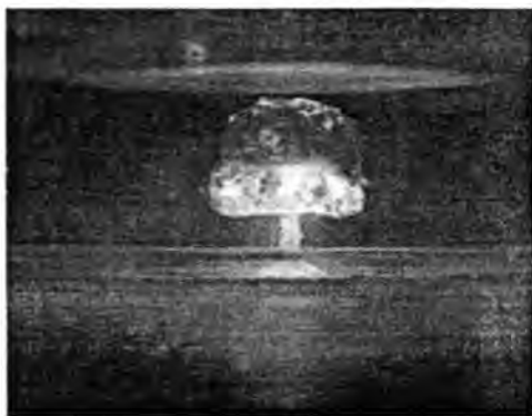
وینهی چهکی کۆکوژ