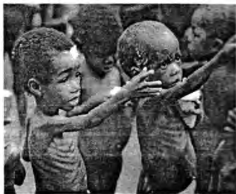
نونهی برسیه تی

* نه م وتاره م له که نالی سپیده / بهرنامه ی پۆشنایی له (۲۰۱۳/۳/۵) نو باره م کرده وه + وه ههروه هاله گۆفاری (جودی) وه زاره تی نه وقافیش ژماره (۱۰) بلا و کرا وه ته وه