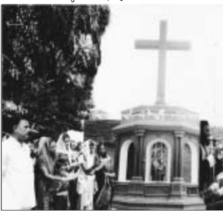
അൽമായവേദി പ്രവർത്തകർ കുന്ദൻകുരിശ് സ്മാരക കുരിശിൽ കാതോലിക്കാദിന പ്രതിജ്ഞ എടുക്കുന്നു.