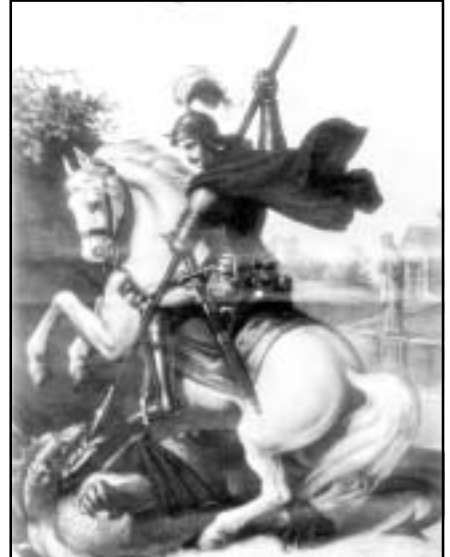
സുറിയാനി രീതിയിൽ മേടം 23-നു മാത്രമായി.

എന്നാൽ പൗരസ്ത്യ സുറിയാനി സഭാ പഞ്ചാംഗപ്രകാരം മാർ ഗീവർഗീസ് സഹദായുടെ പെരുനാൾ മേടം 24-ലും മറ്റു സഭകൾക്ക് മേടം 23-മായിരുന്നു എന്നത് ഒരു പ്രശ്നമായി. പത്തൊമ്പതാം നൂറ്റാണ്ടുവരെ ഈ പ്രശ്നം നിലനിന്നിരുന്നു. തൽക്കാലം രണ്ടു ദിവസവും പെരുനാളായി ആഘോഷിച്ചാണ് പതിനെട്ടാം പത്തൊമ്പതാം നൂറ്റാണ്ടുകളിൽ നസ്രാണികൾ പ്രശ്നം പരിഹരിച്ചത്. 1876-നു ശേഷം പെരുനാൾ പാശ്ചാത്യ