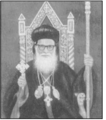
പരിശുദ്ധ ബസ്സേലിയോസ് ഔഗേൻ കാതോലിക്കാ ബാവ

ഉത്തമന്മാരായ മേല്പട്ടക്കാരെയും ശക്തമായ ഭദ്രാസനങ്ങളെയും കലഹം ശമിച്ച സഭയേയും പ്രബുദ്ധരായ സഭാ സ്നേഹികളേയും കണ്ടശേഷം സംതൃപ്തിയോടെയാണ്