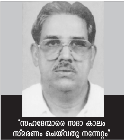
“സഹദേന്മാരെ സദാ കാലം സ്മരണം ചെയ്വതു നന്നേറ്റം”