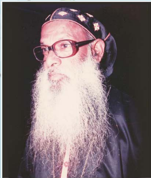
സബരിയ മാർ ദിവന്നാസിയോസ് മെത്രാപ്പോലീത്ത, ചെന്നൈ, ജൂലൈ 7 പത്തനാപുരം താബോർ ദയറ