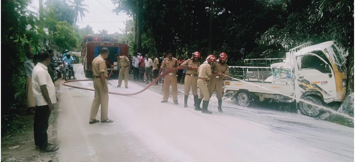
മലയിൻകീഴ് നാലാംകല്ലിന് സമീപം പെയിന്റ് ലോറി മരത്തിലിടിച്ച് ഉണ്ടായ അപകടത്തെ തുടർന്ന് റോഡിൽ വീണ പെയിന്റ് കിള്ളി പെയർഫോഴ്സ് യൂണിറ്റ് വ്യത്തിയാക്കുന്നു.

സംസ്ഥാന മലിനീകരണനിയന്ത്രണ ബോർഡിലെ ഉദ്യോഗസ്ഥരും കൂടെയുണ്ടായിരുന്നു. തെറ്റിയാർ സർവ്വേക്ക് നേതൃത്വം നൽകിയ ഹെഡ് സർവ്വേയർ ആർജോയിയും തെളിവെടുപ്പിന് എത്തിയിരുന്നു. ടെക്നോപാർക്ക് വളപ്പിനുള്ളിൽ തെറ്റിയാർ ശരിമാറ്റി വിട്ടിരിക്കുന്നത് സംഘത്തിന്റെ ശ്രദ്ധയിൽ പെട്ടു. ഇതിന് പുറമെ ടോപ്പിംഗിൽ നിന്നും റോഡാക്കിയതും ഒരു കമ്പനി