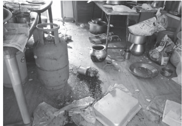
ഹോട്ടൽ അടിച്ച തകർത്ത നിലയിൽ (ഫയൽ ചിത്രം)

തർക്കമാണ് ആക്രമണത്തിൽ കലാശിച്ചതെന്ന് പൊലീസ് പറയുന്നു. സംഭവ സ്ഥലത്ത് നിന്ന് ലഭിച്ച മണലിമുക്കുകളുടെ നമ്പർ കേന്ദ്രീകരിച്ച് പൊലീസ് അന്വേഷണം ആരംഭിച്ചെങ്കിലും ഇതേക്കുറിച്ച് സൂചന ലഭിച്ച പ്രതികൾ ഒളിവിൽ പോകുകയായിരുന്നു. കഴിഞ്ഞ ദിവസം