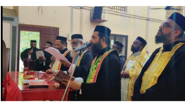
കട്ടച്ചിറ പള്ളിയിൽ ഓർത്തഡോക്സ് വിഭാഗം വൈദികരുടെ നേതൃത്വത്തിൽ നടന്ന സന്ധ്യനമസ്കാരം