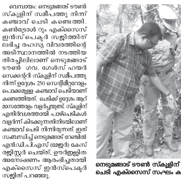
നെടുമങ്ങാട് ടൗൺ സ്കൂളിന് സമീപം വളർന്നു നിന്ന കമ്പോളം ചെടി എക്സൈസ് സംഘം കണ്ടെത്തിയപ്പോൾ