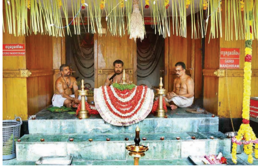
ബലിസത്യയോക്തൃബന്ധിച്ച് കരിക്കം ശ്രീ ചാമുണ്ഡി ക്ഷേത്രത്തിൽ നടന്ന പ്രത്യേക ചടങ്ങ്