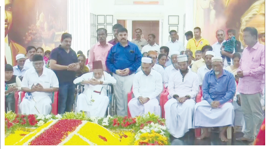
അന്തരിച്ച മുൻ രാഷ്ട്രപതി ഡോ. എ പി ജെ അബ്ദുൾ കലാമിന്റെ നാലാം ചരമവർഷികദിനത്തിൽ രാമേശ്വരത്ത് സംഘടിപ്പിച്ച ചടങ്ങിൽ അദ്ദേഹത്തിന്റെ കുടുംബാംഗങ്ങൾ ആദരസൂചി അർപ്പിച്ചപ്പോൾ

ന്യൂസിക്കുക. സെപ്റ്റംബറിൽ ഇവയെ ഔദ്യോഗികമായി സേനയുടെ ഭാഗമാക്കും. 2015 സെപ്റ്റംബറിലാണ് ഇതിനായി ബോയിംഗുമായി കരാർ ഒപ്പിട്ടത്. വ്യോമസേനയ്ക്ക് പുറമെ കരസേനയ്ക്ക് വേണ്ടി ആറ് അപ്പാന്റെ ഹെലികോപ്റ്റർ കൂടി ഇന്ത്യ വാങ്ങുന്നുണ്ട്. അപ്പാന്റെ എച്ച്-64-ൽ ഹെലികോപ്റ്ററുകൾ ലോകത്തിലേറ്റവും മികച്ചവയെന്നാണ് നിലയിരുത്തുന്നത്. അമേരിക്കൻ സൈന്യം ഉൾപ്പെടെ 14 രാജ്യങ്ങളുടെ സൈന്യത്തിന്റെ ഭാഗമാണ് അപ്പാന്റെ ഹെലികോപ്റ്റർ. 2020 ആകുമ്പോഴേക്കും 22 ഹെലികോപ്റ്ററുകളും വ്യോമസേനയുടെ ഭാഗമാക്കും.