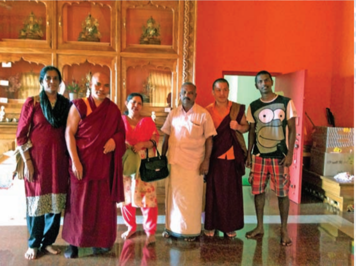
(അടുത്ത ആഴ്ചയിൽ പുർണമാകും)

ക്ഷേത്രം കണ്ടുകഴിഞ്ഞ് മടിക്കേരിയിൽ വിനോദസഞ്ചാരികൾ എത്താറുള്ള രാജാസ് സീറ്റ് (രാജാവിന്റെ ഇരിപ്പിടം) കാണാൻ പോയി. ചെറുതായി മഴ തുടങ്ങിയിരുന്നു. മഴക്ക് കൂട്ടായി മുടൽമഞ്ഞും, രാജഭരണകാലത്ത് രാജാവും കുടുംബാംഗങ്ങളും പ്രകൃതി ഭംഗി ആസ്വദിക്കാൻ വന്നിരിക്കുന്ന സ്ഥലമായിരുന്നു. രാജാസ് സീറ്റിൽ നിന്നും താഴ് വാരത്തിലേക്ക് എത്ര നേരം നോക്കി നിന്നാലും മതിവരില്ല. മലനിരകളിലൂടെ കോടമഞ്ഞു ഒഴുകിപ്പോകുന്ന മനോഹരമായ കാഴ്ച കാണാം. ഒരുപാട് ടൂറിസ്റ്റുകൾ അവിടെ ഉണ്ടായിരുന്നു. ഞങ്ങളും ആ കൂട്ടത്തിൽ മനോഹരമായ കാഴ്ചകൾ കണ്ടു. തണുത്ത കാറ്റും മുടൽമഞ്ഞും കൂടിയപ്പോൾ അന്നത്തെ യാത്ര മതിയെന്ന് തിരിച്ചുപോന്നു. രാത്രി കൂടുക തീരിയിലുള്ള അക്കി റോട്ടിയും (അരി കൊണ്ടുള്ള ചുട്ടപ്പത്തി) പോർക്ക് പ്രൈയം കഴിച്ചു. അവിടെയുള്ളവർ കൂടുതലും സന്ധ്യകൂലികളാണെങ്കിലും കുർശിലുള്ളവർ മംസഭക്ഷണം പ്രിയമുള്ളവരുമാണ്. ഇവരുടെ പ്രധാന ഭക്ഷണം പന്നിയിറച്ചിയാണ്. മുളകുവും മുളയരയും കുർശിക്കാരുടെ ഇഷ്ടവിഭവമാണ്.