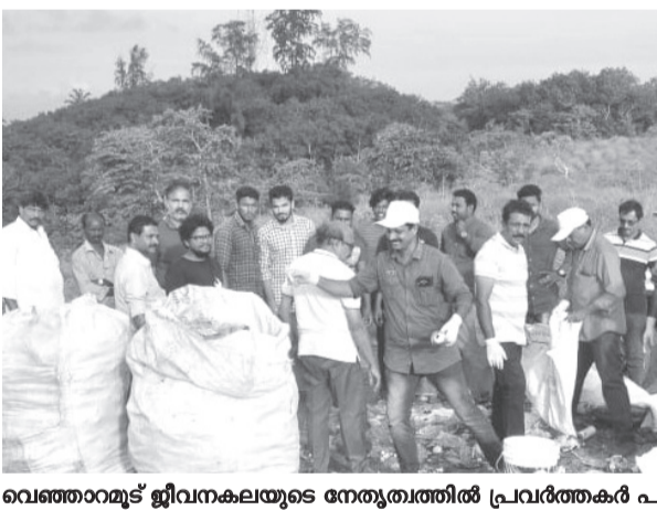
വെഞ്ഞാരുമുട് ജീവകലയുടെ നേതൃത്വത്തിൽ പ്രവർത്തകർ പാഠമുകൾ ശുചിയാക്കുന്നു.