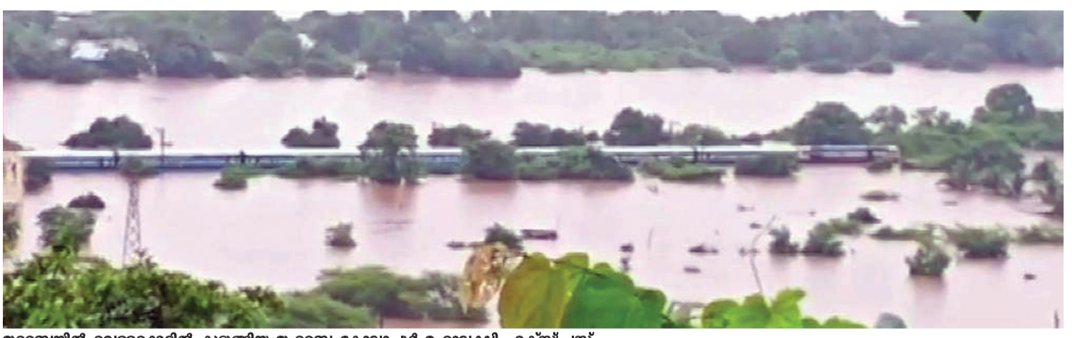
മുബൈയിൽ വെള്ളക്കെട്ടിൽ കുടുങ്ങിയ മുബൈ-കോലാപ്പൂർ മഹാലക്ഷ്മി എക്സ്പ്രസ്സ്