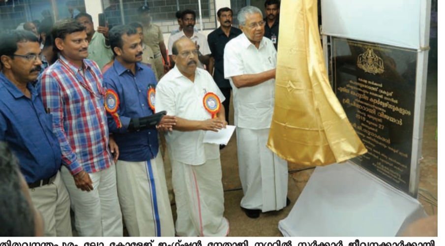
തിരുവനന്തപുരം ലോകോളേജ് ജൂംഗിൾ നേതാജി നഗറിൽ സർക്കാർ ജീവനക്കാർക്കായി നിർമ്മിക്കുന്ന ക്യാർട്ടേജ്സിന്റെ ശിലാസ്ഥാപനം മുഖ്യമന്ത്രി പിണറായി വിജയൻ നിർവഹിക്കുന്നു.

തിരുവനന്തപുരം: സർക്കാർ ജീവനക്കാരുടെ ക്യാർട്ടേജ്സുകളുമായി ബന്ധപ്പെട്ട ജീവനക്കാരുടെ പരാതികൾ ഗൗരവമായി പരിശോധിക്കുമെന്ന് മുഖ്യമന്ത്രി പിണറായി വിജയൻ. വിഴ്ചല വരുത്തുന്നവർക്കെതിരെ കർശന നടപടി സ്വീകരിക്കുമെന്നും അദ്ദേഹം പറഞ്ഞു. തിരുവനന്തപുരം ലോകോളേജ് ജൂംഗിൾ നേതാജി നഗറിൽ സർക്കാർ ജീവനക്കാർക്കായി പൊതുമാതൃകയിൽ വകുപ്പ് നിർമ്മിക്കുന്ന ക്യാർട്ടേജ്സുകളുടെ ശിലാസ്ഥാപനം നിർവഹിച്ചു സംസാരിക്കുകയായിരുന്നു മുഖ്യമന്ത്രി.