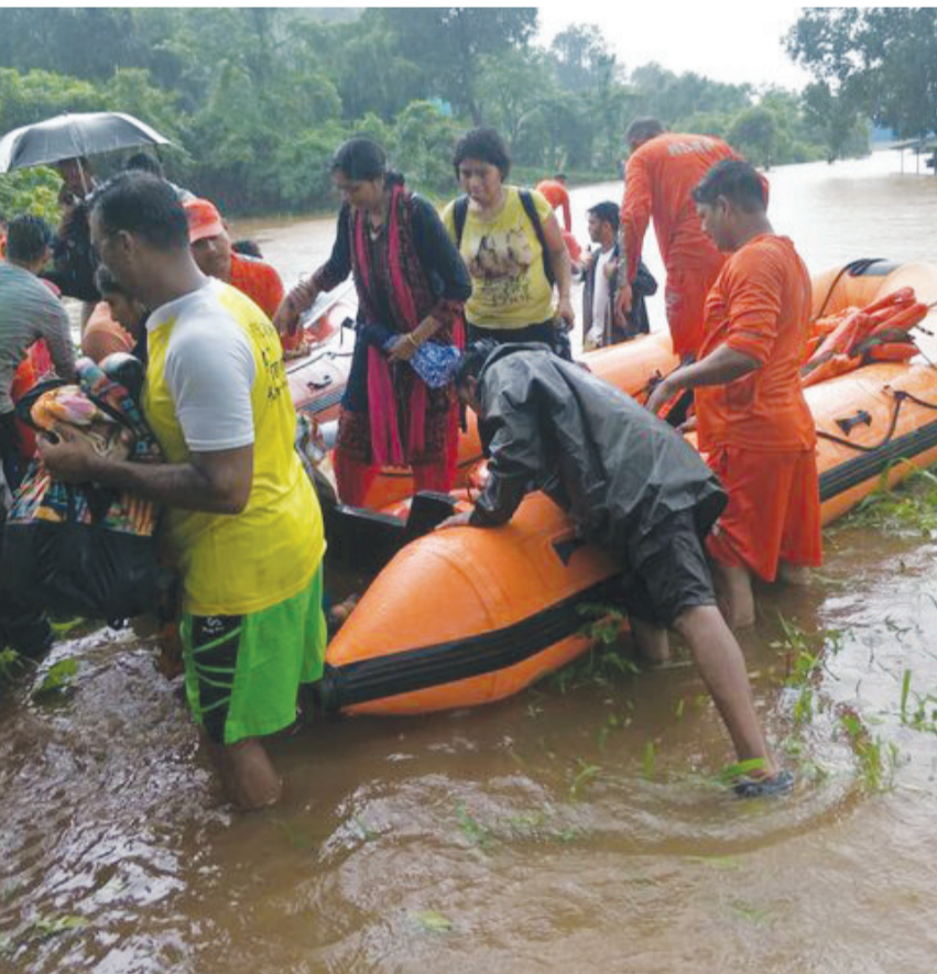
മുംബൈ കോലാപൂർ മഹാലക്ഷ്മി എക്സ്പ്രസിൽ നിന്ന് യാത്രക്കാരെ രക്ഷപ്പെടുത്ത ദേശീയ ദുരന്തനിവാരണ സേന