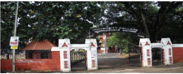
മതിൽ കെട്ടിന് പുറത്തുനിന്നും വിദ്യാർത്ഥി പ്രതിഷേധത്തെ തുടർന്നാണ് ഉന്നത ഉദ്യോഗസ്ഥർ ഇടപെട്ട് പൊലീസിനെ പിൻവലിച്ചത്.

തിരുവനന്തപുരം: യൂണിവേഴ്സിറ്റി കോളേജിൽ സഹപാഠിയെ കൂത്തിയ കേസിൽ ഉൾപ്പെട്ടവരുടെ വിദ്യാർത്ഥികളെ കൂടി സസ്പൻഡ് ചെയ്തു. ഇതോടെ സംഭവവുമായി ബന്ധപ്പെട്ട് സ്പെൻഡർമാരുടെ എണ്ണം 15 ആയി. അതേസമയം, കോളേജിൽ വിന്യസിച്ചിരുന്ന പൊലീസിനെ പുറത്താക്കി. എഎസ്എ അടക്കം അഞ്ച് പൊലീസുകാരാണ് സുരക്ഷാ ചുമതലയ്ക്ക് കോളേജിനുള്ളിൽ ഉണ്ടായിരുന്നത്. ഇന്നലെ രാത്രി പുറത്തിറങ്ങാനുള്ള നിർദ്ദേശത്തെ തുടർന്ന് ഇവർ