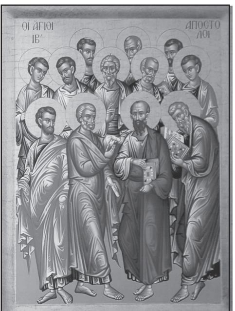
ദേശത്തിന്റെ കാവൽപിതാക്കന്മാരായ പന്തിരു ശ്ലീഹന്മാരേ ഞങ്ങൾക്കു വേണ്ടി അപേക്ഷിക്കണമേ

മരണവുകളും ഉണങ്ങിയ ഇലകളും ചേർത്തുണ്ടാക്കിയ ഒരു കുടിലോ, വലിയ മരത്തിന്റെ ശാഖകളിൽ പിടിപ്പിച്ച ഒരു ഏറ്റുമാടമോ പാറപ്പൊത്തുകളിൽ ഒരുക്കിയ ഒരു സങ്കേതസ്ഥലമോ ഒക്കെ ആയിരുന്നിരിക്കാം ആദ്യത്തെ വീടുകൾ. ആവശ്യാനുസരണം അഴിച്ചുമാറ്റി സ്ഥാപിക്കാവുന്ന കുടാരങ്ങളും അനേക വർഷങ്ങൾ നിൽക്കുന്ന, തടിയും കല്ലും ഉപയോഗിച്ചുള്ള കെട്ടിടങ്ങളും പിൻക്കാലത്ത് നിർമ്മിക്കപ്പെട്ടു. ഭവന നിർമ്മാണ കലയിലുള്ള പ്രാവീണ്യം സാംസ്കാരികോന്നതിയുടെ അളവുകോലായിത്തീർന്നു. ഇരസപ്പോത്തേമിയയിലും ഈജിപ്തിലും മെസപ്പൊട്ടമിയയിലും ഗ്രീസിലുമെല്ലാം ഉണ്ടായ പുരാതന സംസ്കാരങ്ങളുടെ കഥ നാം മനസ്സിലാക്കുന്നത് മുഖ്യമായും അവരുടെ ഭവനങ്ങളും ദേവാലയങ്ങളും നഗരങ്ങളും മറ്റും പണിതതിന്റെ ബാക്കിപത്രങ്ങളിൽ നിന്നാണ്.