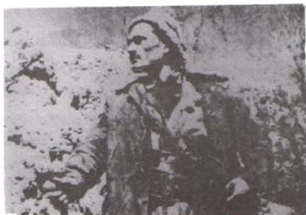
تيگوشمر مهلا شاواره