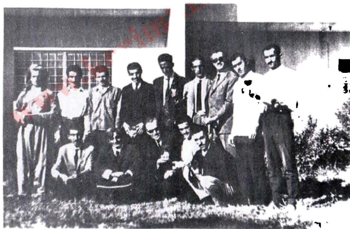
اموستا همین و نوسهر له گیل کادره کاسی حیزری دیموکرات له کلاسی کادر دا