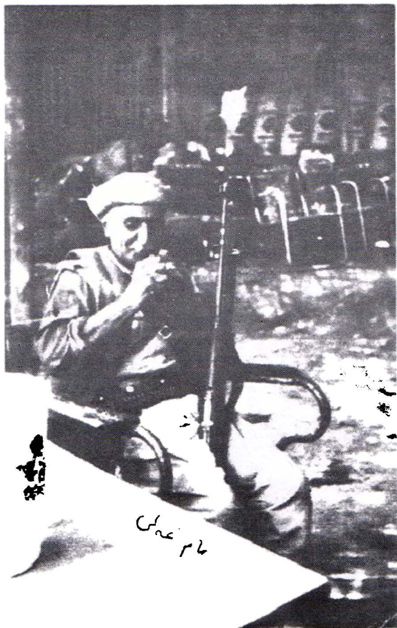
مام علی رحممتی که : " ۱۲ تیمامی وه لاناوو، ببوو به کورد "